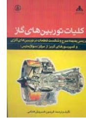
کلیات توربین های گاز، بررسی پدیده سرج و شکست قطعات در توربین های گازی و کمپرسورهای گریز از مرکز (سولارمارس) نویسنده فریدون خسرویان همای ۱۰۶ صفحه