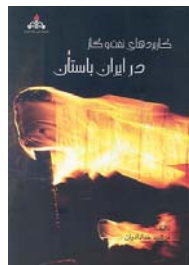
کاربردهای نفت و گاز در ایران باستان تالیف فرشید خدادادیان صفحه ۳۱۲