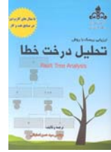
ارزیابی ریسک با روش تحلیل درخت خطا ترجمه و تالیف سید حسن اصفهانی صفحه ۲۴۳