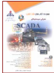
معرفی سیستم های SCADA نویسنده: وحید سعیدی ۲۷۲ صفحه