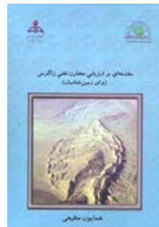
مقدمه ای بر ارزیابی مخازن نفتی زاگرس (برای زمین شناسان) نویسنده: همایون مطیعی ۲ جلد : ۸۱۵ صفحه