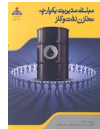
مبانی مدیریت یکپارچه مخازن نفت و گاز ترجمه و تالیف محمد علی عمادی، عباس قبادی ۴۱۰ صفحه