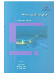
جریان چند فاز در چاه ها ترجمه سمانه سروش، پیمان پورافشاری، بنفشه الماسی نیا صفحه ۴۷۲