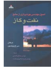
اصول مهندسی بهره برداری از منابع نفت و گاز ترجمه: صادق قاسمی، فرخ شعاعی فرد خمسه صفحه ۶۸۸