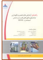
راهنمای آزمایش ها و تعمیر و نگهداری ترانسفورماتورهای قدرت بر اساس استاندارد IEEE تالیف و ترجمه مهدی رمضانی صفحه ۱۰۳