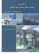
درآمدی بر سیاست های صنعت نفت جهانی ترجمه ناصر تیموری خانه سری صفحه ۳۹۲