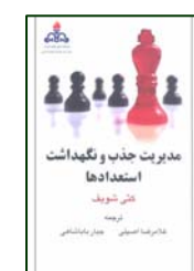
مدیریت جذب و نگهداشت استعدادها ترجمه غلامرضا اصیلی، جبار باباشاهی ۱۵۷ صفحه