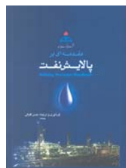
مقدمه ای بر پالایش نفت ترجمه حسن اقبالی ۳۹۰ صفحه