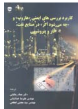
کاربرد بررسی های ایمنی "هازوپ" و "چه می شود اگر" در صنایع نفت، گاز و پتروشیمی ترجمه: عماد رعایایی، علیرضا خدائشناس، سید مجتبی ابطحی صفحه ۱۵۰